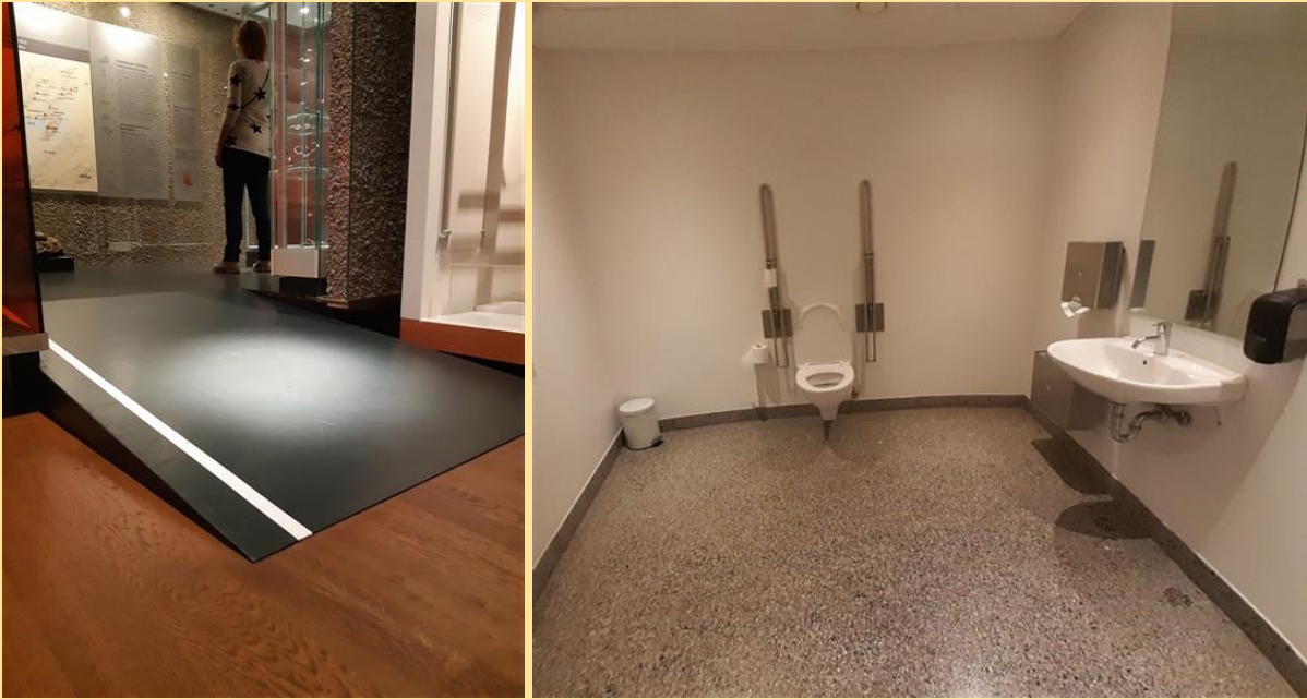
Rolstoel glooiingen waar nodig, schone toiletten